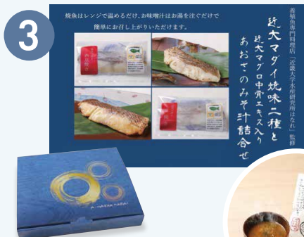
③ 近大マダイ焼味二種と 近大マダイ中骨エキス入り あおさのみそ汁詰合せ