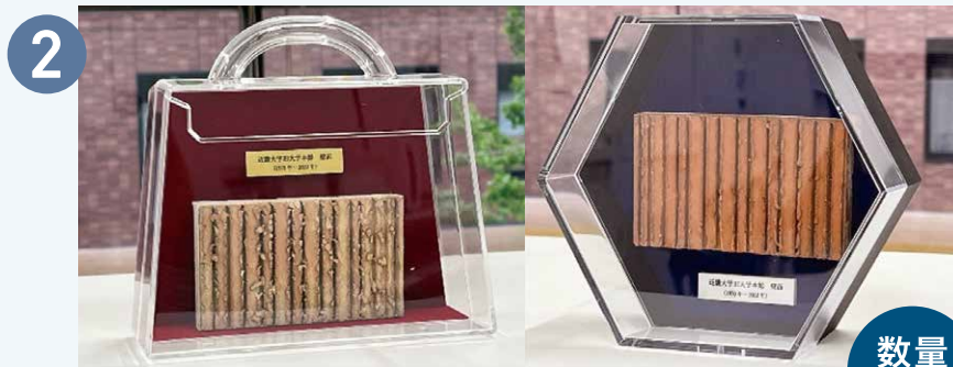
② 旧・大学本館外壁煉瓦タイルのハンドメイド・オブジェ