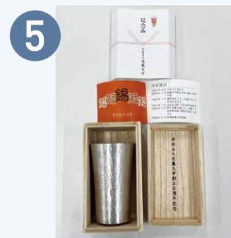
⑤ 近大100周年記念 オリジナル錫タンブラー