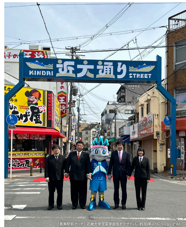
〈長瀬駅前アーチ〉近畿大学文芸学部生がデザインし、約30年ぶりにリニューアル!