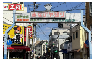
〈長瀬駅前アーチ〉リニューアル前の看板

このアーチ看板は、学生が新しいシンボルとして商店街の活性化に繋げることをめざしてデザインしたものです。東大阪キャンパスにお立ち寄りの際はぜひご覧ください。