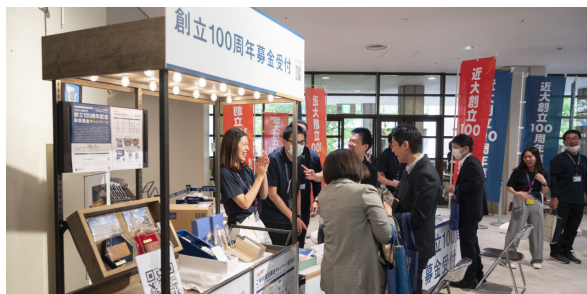
100周年特設ブース(11月ホール)

また、創立100周年記念事業募金キャンペーンとして100周年特設募金ブースも設け、当日限りの様々な限定記念品をご用意。和気あいあいと卒業生の皆様をお迎えしました。