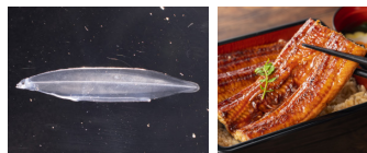
完全養殖を達成したニホンウナギの仔魚 (イメージ写真)

近畿大学水産研究所は、ニホンウナギの種苗生産研究に取り組んでおり、2023年7月6日、人工種苗から養成した親魚より仔魚を得ることに成功し、完全養殖を達成しました。ウナギの完全養殖については、大学としては初の成果となります!まずは養殖用種苗として利用可能になるシラスウナギ(稚魚)までの育成を第一目標としています。今後、仔魚用飼料の改良に取り組むなどして、育成技術の安定化に向けた研究を続けます。