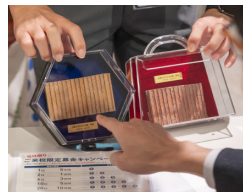
旧・大学本館(東大阪キャンパス)外壁煉瓦タイルのハンドメイド・オブジェ。 ※デザインは選べません。

2025年の100周年まで、皆様の継続的なご支援・ご協力を、よろしくお願いたします。