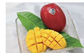
近大マンゴー (寄附金額:50万円以上)