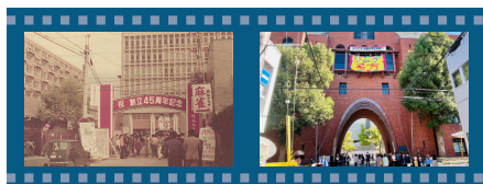
左:1970年生駒祭 右:2022年生駒祭