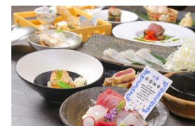
近畿大学水産研究所寄附者様限定コース御食事券 (寄附金額:100万円以上)

寄附者様全員のご芳名はweb芳名録に、さらに寄附金額10万円以上で銘板に、寄附金額300万円以上で記念碑に、永く顕彰させていただきます。 (芳名掲載につきましては匿名希望の方を除きます)