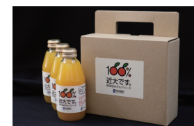
無添加みかんジュース「100%近大です。」 (寄附金額:5万円以上)

個人でご寄附賜りました方には、附属農場産の近大マンゴー(愛紅・アーウィン)、近大みかんといった農産品や水産研究所産の養殖魚の加工品をはじめとする特産品や産学連携商品、2013年に開店した「近大卒の魚と紀州の恵み 近畿大学水産研究所」(大阪店及び銀座店)でご利用いただける寄附者様限定コース御食事券等、ご寄附の累計額に応じて、近畿大学ならではの実学研究成果を記念品として謹呈いたします。