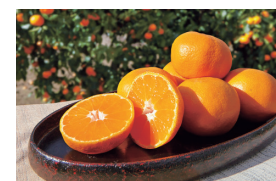
近大みかん (寄附金額:10万円以上)