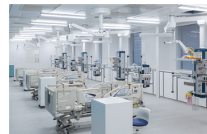
ICUなどが入る高機能病棟