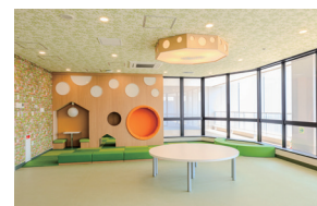
小児病棟プレイルーム