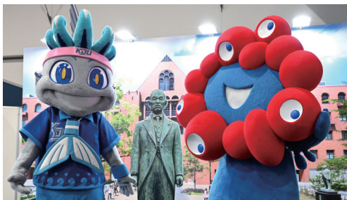
(左から)近畿大学体育会公式マスコット「KINDAI BIG BLUE」、世耕弘一先生(像)、大阪・関西万博 公式キャラクター「ミクミキ」